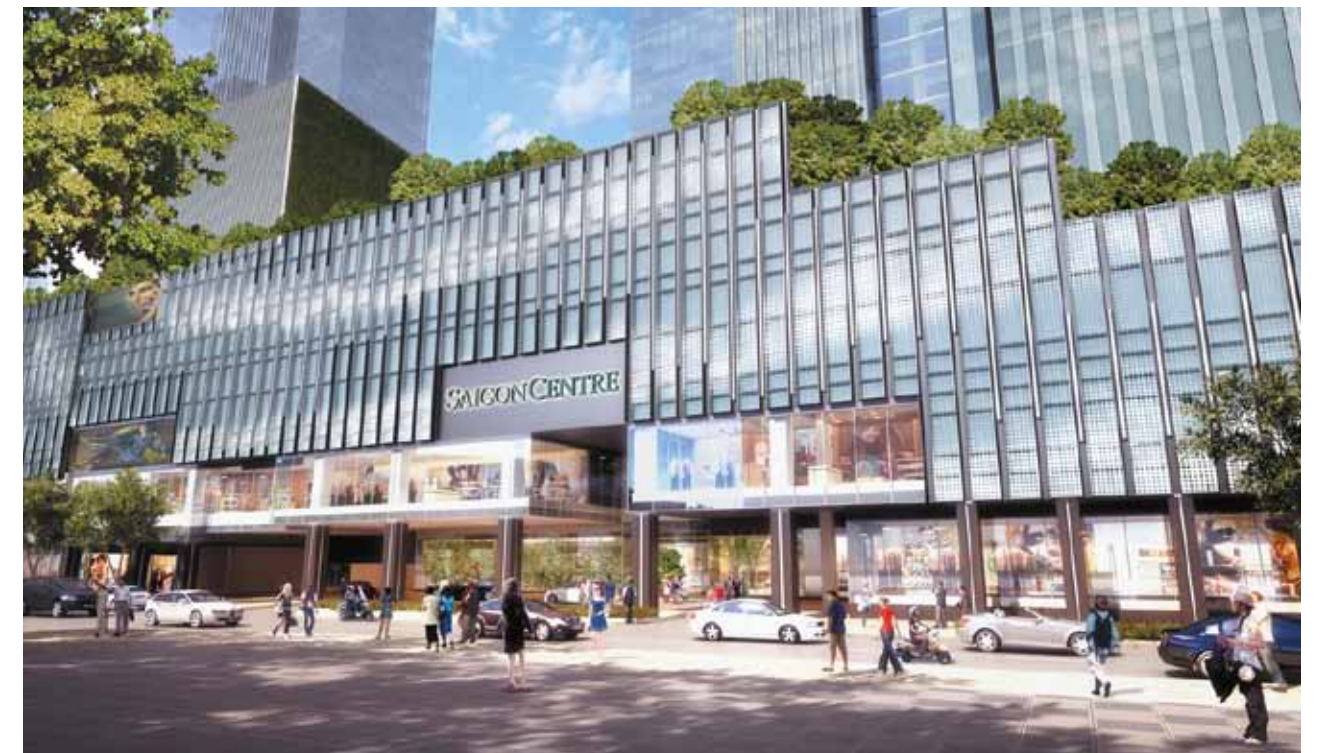
Phối cảnh dự án Saigon Centre (giai đoạn 2)