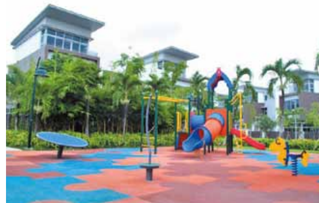
Sân chơi trẻ em