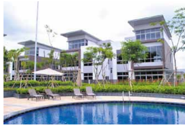
Khu biệt thự gần hồ bơi

Văn phòng kinh doanh dự án Riviera Cove Phòng 6, Lầu 7, Saigon Centre 65 Lê Lợi, Quận 1, Tp.HCM Tel: (848) 38 989 999 - Fax: (848) 39 144 553 Email: info@rivieracove.com.vn - www.rivieracove.com.vn