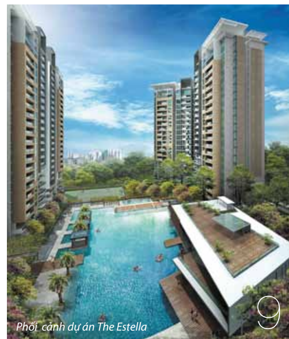
Phối cảnh dự án The Estella