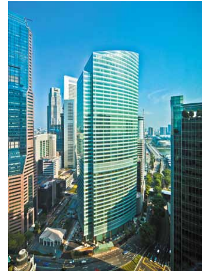
Ocean Financial Centre đạt được đánh giá 5 sao - số điểm cao nhất trong ba hạng mục của Giải thưởng Bất động sản quốc tế 2012

Tòa tháp văn phòng Hạng A cao 43 tầng này đã được trao tặng Giải thưởng Trung tâm thương mại cao tầng tốt nhất, Dự án cao ốc văn phòng tốt nhất và Kiến trúc cao ốc văn phòng tốt nhất tại khu vực Châu Á Thái Bình Dương. Dự án Riviera Point tại Quận 7, Tp. Hồ Chí Minh cũng đã được tuyên dương xuất sắc cho hạng mục "Dự án phức hợp" tại Việt Nam tại giải thưởng này.