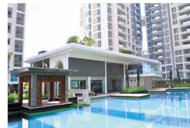
Hồ bơi và nhà câu lạc bộ