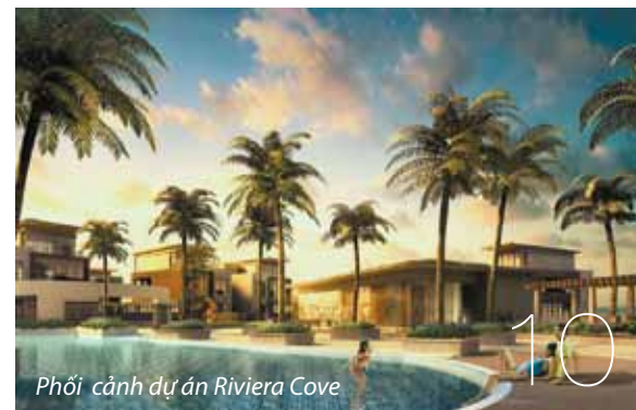
Phối cảnh dự án Riviera Cove