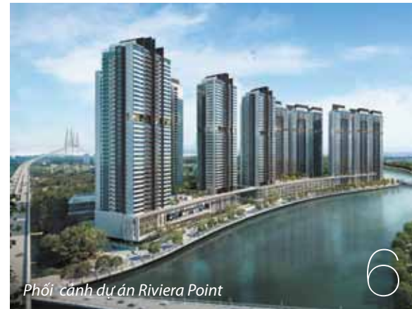
Phối cảnh dự án Riviera Point

13 Những dấu ấn nổi bật Mark of distinction