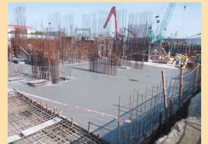
Toàn cảnh tiến độ xây dựng tại Công trình dự án Riviera Point

Nhà mẫu Riviera Point Lối vào cạnh số 582 Huỳnh Tấn Phát, Quận 7, Tp. Hồ Chí Minh Tel: (848) 377 38 777 Fax: (848) 377 34 292 Email: rp@keppeland.com.vn - www.rivierapoint.com.vn