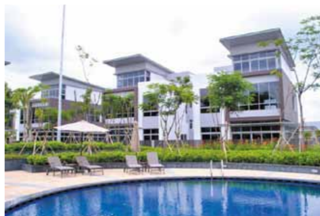
Khu biệt thự gần hồ bơi

Văn phòng kinh doanh dự án Riviera Cove Phòng 6, Lầu 7, Saigon Centre 65 Lê Lợi, Quận 1, Tp.HCM Tel: (848) 38 989 999 - Fax: (848) 39 144 553 Email: info@rivieracove.com.vn - www.rivieracove.com.vn