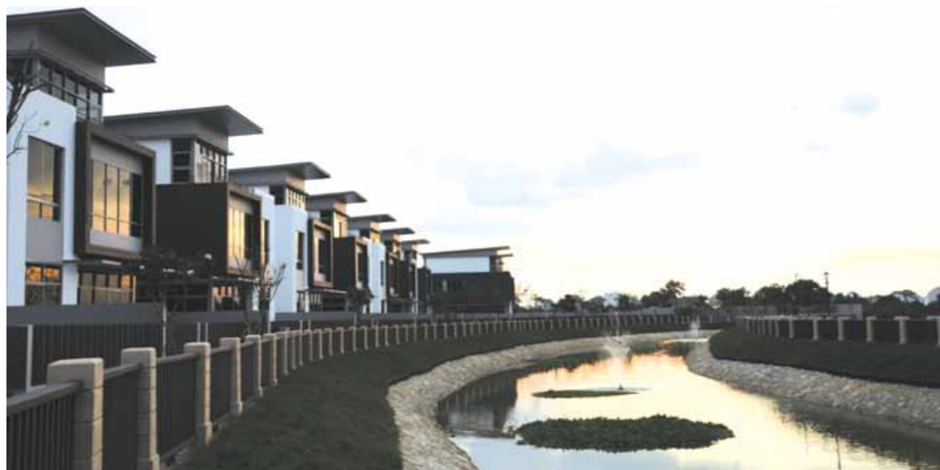
Khu biệt thự ven sông